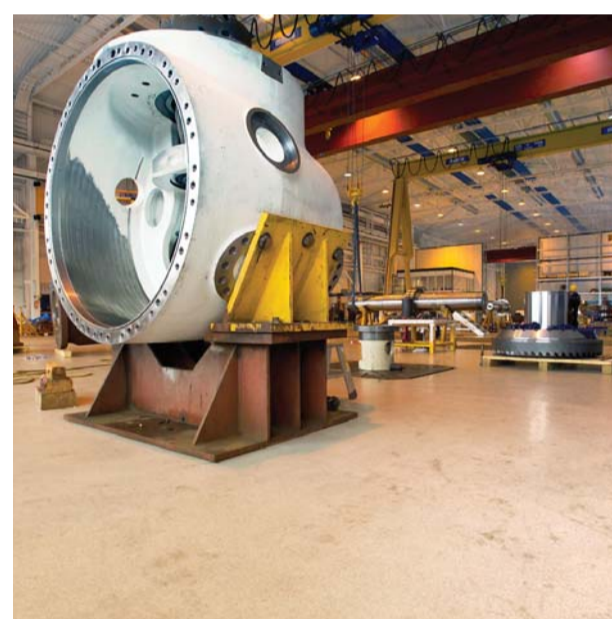
20 tons hi-tech ubådsdele, på mindre end 4 m 2 .