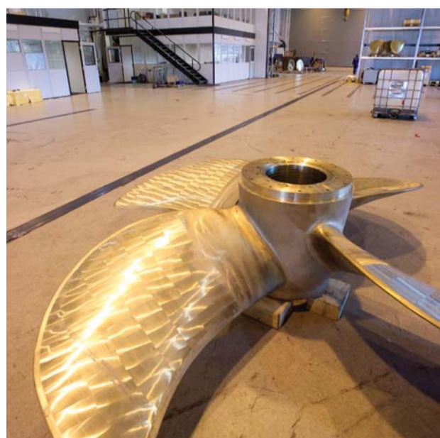
Specialisterne fra Rolls Royce starter med en blok metal, og forvandler den til en gigantisk skibspropel med en diameter på 8 meter. Naturligvis håndlavet.

Rolls Royce Marine, det tidligere Ulsteinværft, ligger på øen Ulsteinvik tæt ved Ålesund i Norge. Strategisk placeret med direkte adgang til Nordsøen, producere værftet udstyr til olie og marine industrien. Mere end 2000 ansatte arbejder her, hvilket gør værftet til den absolut største arbejdsplads i området. Efter Rolls Royce overtog værftet i 2001, iværksatte man en renoveringsplan, for at bringe faciliteterne op i den absolut højeste produktionsstandard. Ingeniørerne forventer at afslutte processen i 2008, hvorefter værftet er det mest moderne af sin slags i verden.